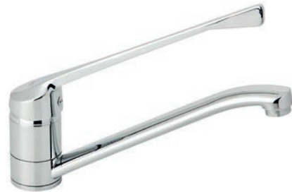
Ref.: 61200 21 45 66 Monomando mezclador de fregadera horizontal medical

Grifo para lavabo monomando mezclador medical para instalar sobre encimera. Cuerpo en latón CC754S y maneta en Zamak cromado, cromado según EN 248. Provisto de cartucho cerámico mezclador D40, aireador plástico antical y conexiones flexibles según EN 13618. Incluye todos los elementos de fijación.