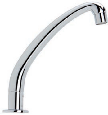
Ref.: 1250 04 Caño giratorio

Caño de llenado giratorio profesional para instalar sobre la encimera. Caño y soporte en latón CW617N cromado según EN 248. Aireador plástico antical. Incluye todos los elementos de fijación.