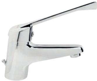
Ref.: 61130 24 45 66 Monomando mezclador de lavabo medical

Grifo para lavabo monomando mezclador medical para instalar sobre encimera. Cuerpo en latón CC754S y maneta en Zamak cromado, cromado según EN 248. Provisto de cartucho cerámico mezclador D40, aireador plástico antical y conexiones flexibles según EN 13618. Incluye todos los elementos de fijación.