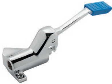
Ref.: 1303 04 Válvula a pedal

Válvula a pedal profesional de suelo. Cuerpo en latón CC754S y pedal y cartucho en latón CW617N, cromados según EN 248. Regulación del caudal instantáneo según la posición del pedal. Cartucho compacto extraíble dotado de filtro de acero inoxidable. Dispositivo anti golpe de ariete. Incluye todos los elementos de fijación.