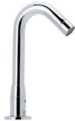
Ref.: 1255 04 Caño giratorio

Caño de llenado giratorio profesional para instalar sobre la encimera. Caño y soporte en latón CW617N cromado según EN 248. Aireador plástico antical. Incluye todos los elementos de fijación.