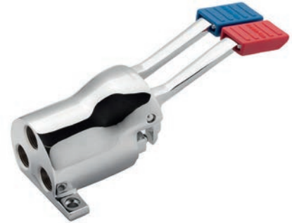
Ref.: 1342 04 Válvula a pedal mezcladora

Válvula a pedal profesional de suelo. Cuerpo en latón CC754S y pedal y cartucho en latón CW617N, cromados según EN 248. Regulación del caudal instantáneo según la posición del pedal. Cartucho compacto extraíble dotado de filtro de acero inoxidable. Dispositivo anti golpe de ariete. Incluye todos los elementos de fijación.